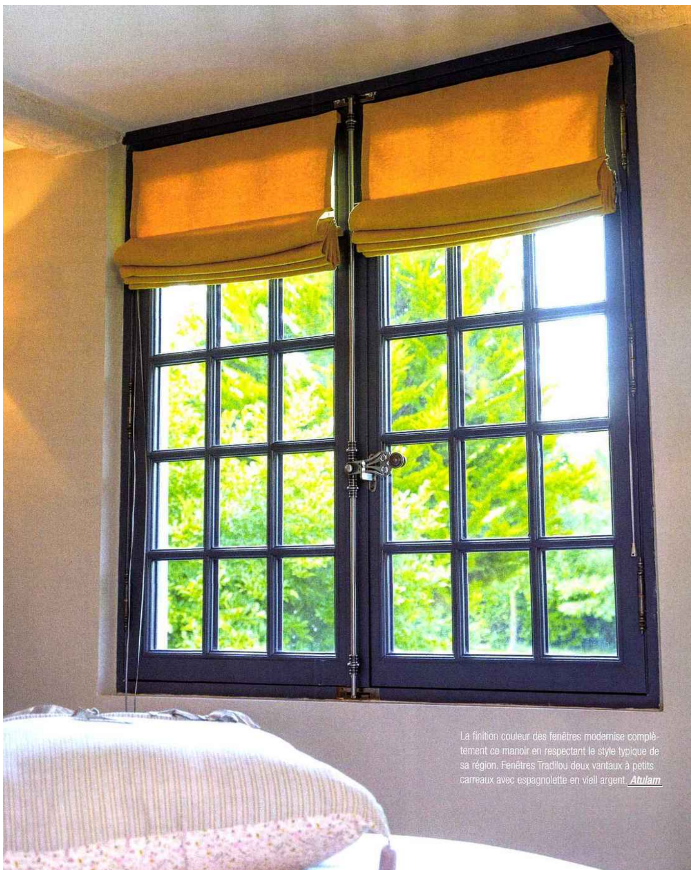
La finition couleur des fenêtres modernise complètement ce manoir en respectant le style typique de sa région. Fenêtres Trad'lou deux vantaux à petits carreaux avec espagnolette en vieil argent. Atulam